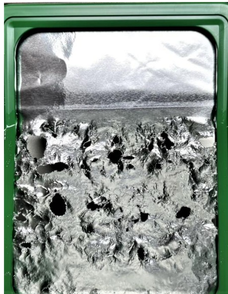
Perfektes Ergebnis nach 5 Minuten Laufzeit