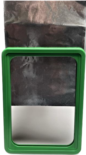
Folie in den Rahmen einfügen