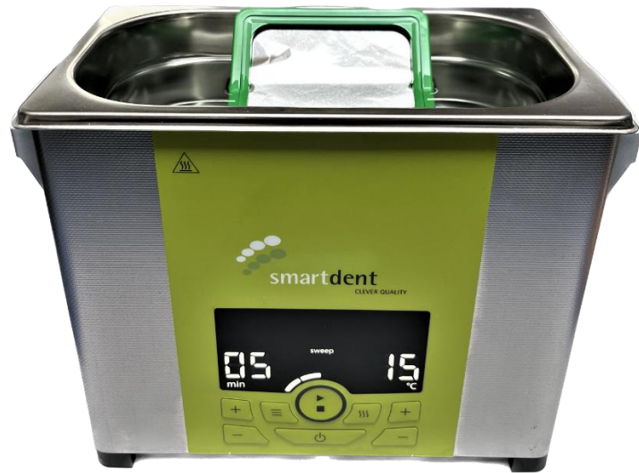
SWEEP Programm mit einer Laufzeit von 5 Minuten starten